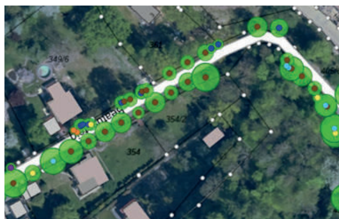
Foto: Baumkartierung mithilfe GPS-basierter Software