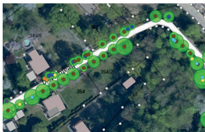
Foto: Baumkartierung mithilfe GPS-basierter Software