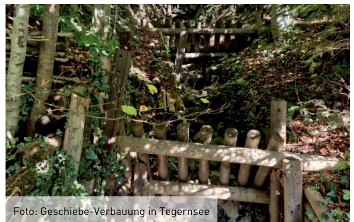
Foto: Geschiebe-Verbauung in Tegernsee