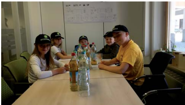
Abb. „MR-Kids“ - Kinder bei der pro communo AG

In der letzten Osterferienwoche durften 5 Kinder unserer Mitarbeiter einen Vormittag bei der pro communo AG erleben. Sie erforschten neugierig, womit ihre Eltern sich in der Arbeit beschäftigen. Fleißig und engagiert halfen sie bei der Büroarbeit. Beim Schreddern, Scannen und Schreiben auf dem White Board hatten die Kinder riesigen Spaß. Sogar eine Besprechung im Vorstandsbüro stand auf dem Programm. Nach getaner Arbeit stärkte man sich in der Eisdielen und beschloss einstimmig, in den nächsten Ferien wieder beim Maschinenring auszuhelfen.